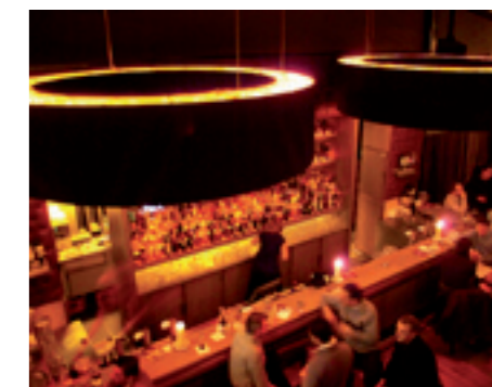
't Nieuwscafé Heilig Hartplein 5, Sint-Truiden www.nieuwscafe.be