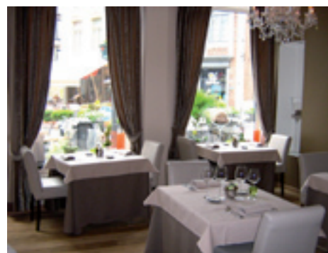
Le Bouquet Garni Ridderstraat 1, Sint-Truiden www.lebouquetgarni.be