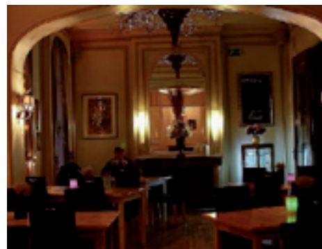
Hotel Brasserie Belle Vie Stationsstraat 12, Sint-Truiden www.belle-vie.be