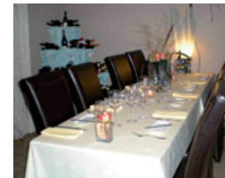
Aspandos Naamsevest 4, 3800 Sint-Truiden