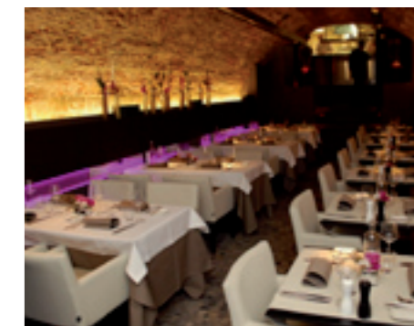
Bigarreux Heilig Hartplein 5, Sint-Truiden www.bigarreux.be