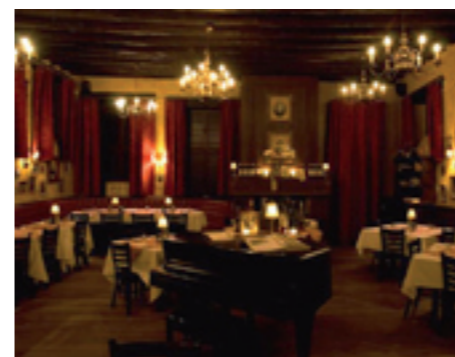
Paulie's Schepen Dejonghstraat 26, Sint-Truiden www.paulies.be