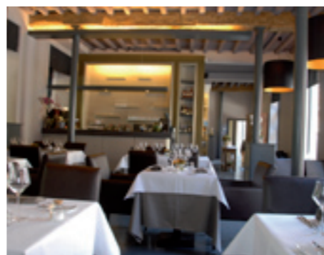
Durondeaux Diesterstraat 44c, Sint-Truiden www.restaurantdurondeaux.be