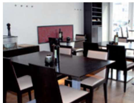
De Bink Grote Markt 39, Sint-Truiden www.debink.be