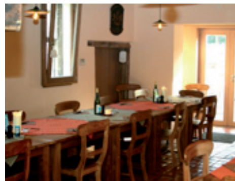
In De Zwaan Klein Gelmenstraat 1, Gelmen