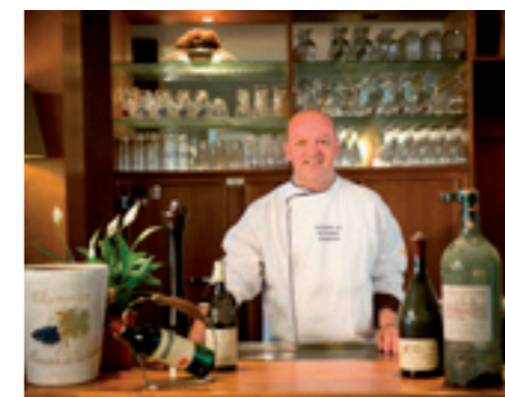
Truiershuis Naamsesteenweg 42, Sint-Truiden www.truiershuis.be