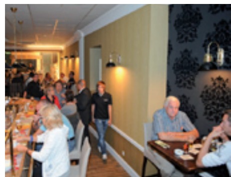
La Tasse Heilig Hartplein 9, Sint-Truiden www.la-tasse.be