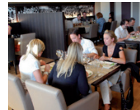
Stayen Tiensesteenweg 168, Sint-Truiden www.stayen.com