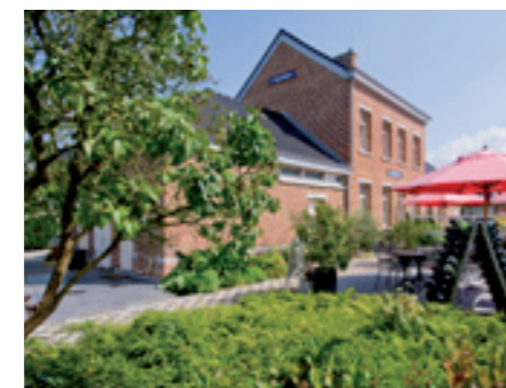
De Statie Wilderenlaan 63, Wilderen www.wilderen-statie.be